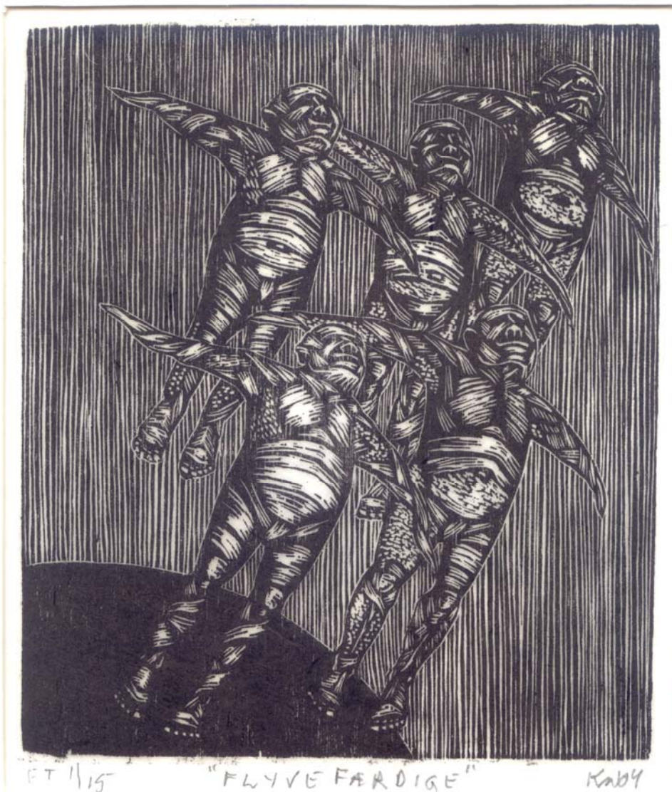
Herover: "Flyvefærdige", træsnit 2004, 17,5 x 15 cm af Kirsten Winther