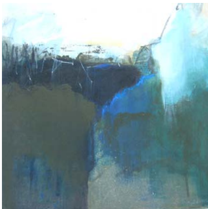
"Moor 1 / Mose 1", 1983, acryl på masonit, 30 x 30 cm. Signeret nederste højre hjørne Kr. 2.000