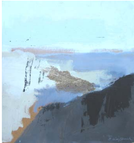
"By the Sea / Ved havet", ca. 1983, acryl på masonit 30,5 x 28,5 cm. Signeret nederste højre hjørne Kr. 2.000