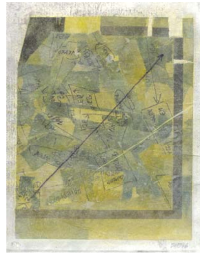
"Der Weg aus Babylon", 1996, papircollage, blyant, acryl, 25,5 x 21 cm. Signeret og dateret nederste højre hjørne Kr. 2.000