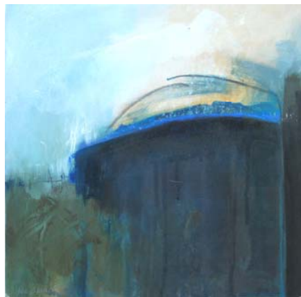
"Moor 2 / Mose 2", 1983, acryl på masonit, 30 x 30 cm. Signeret nederste venstre hjørne Kr. 2.000